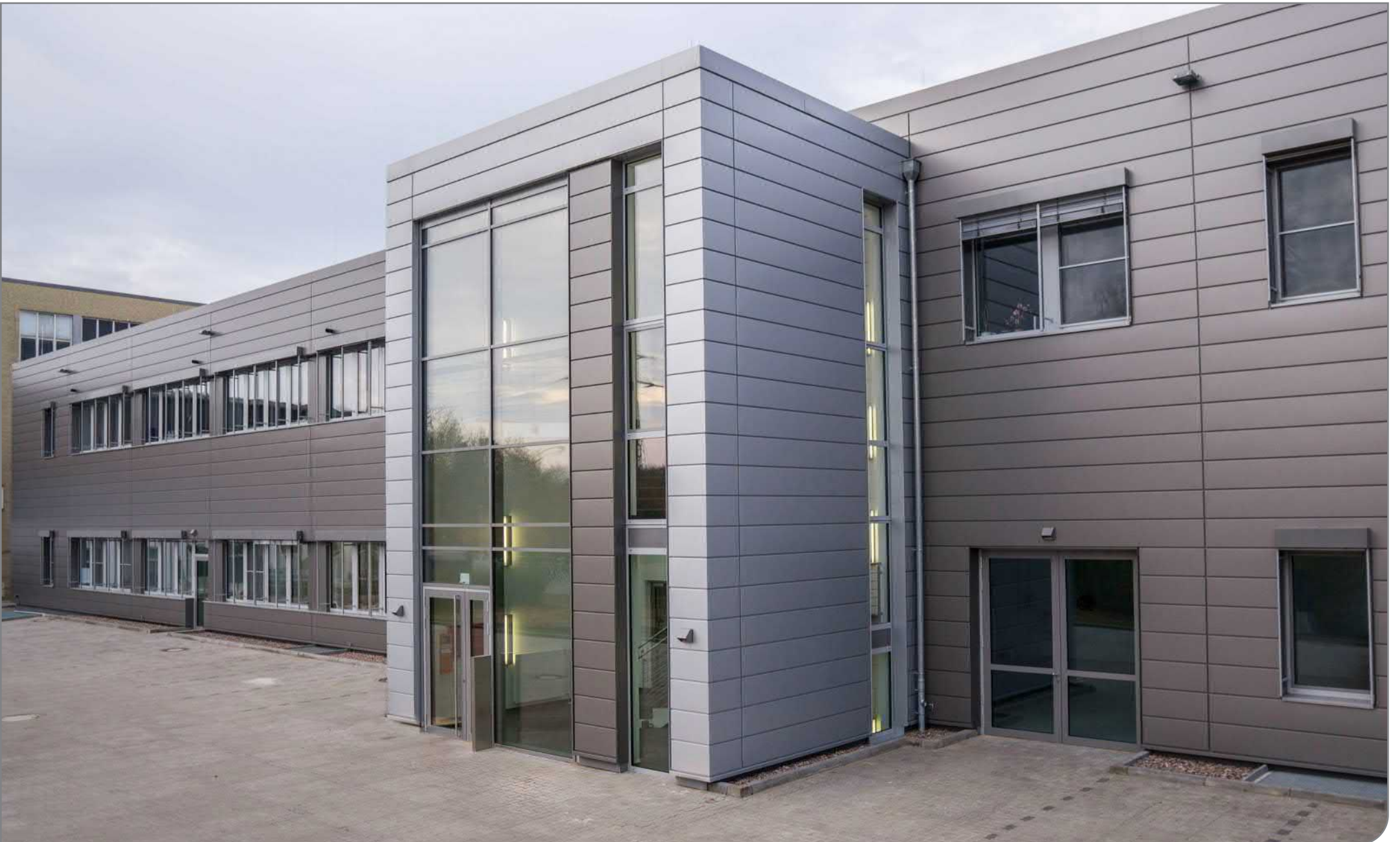
Neubau eines Produktionsgebäudes in Hamburg / gebaut