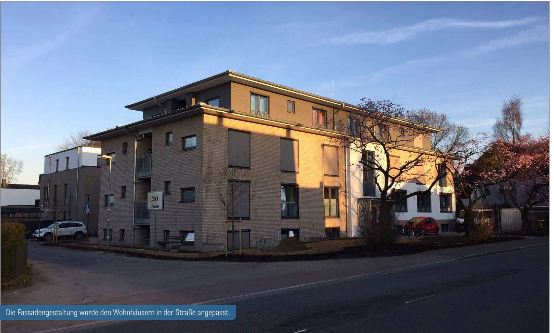
Die Fassadengestaltung wurde den Wohnhäusern in der Straße angepasst.