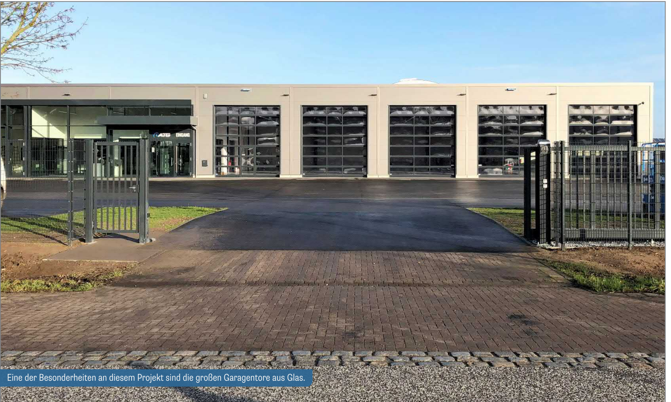
Eine der Besonderheiten an diesem Projekt sind die großen Garagentore aus Glas.