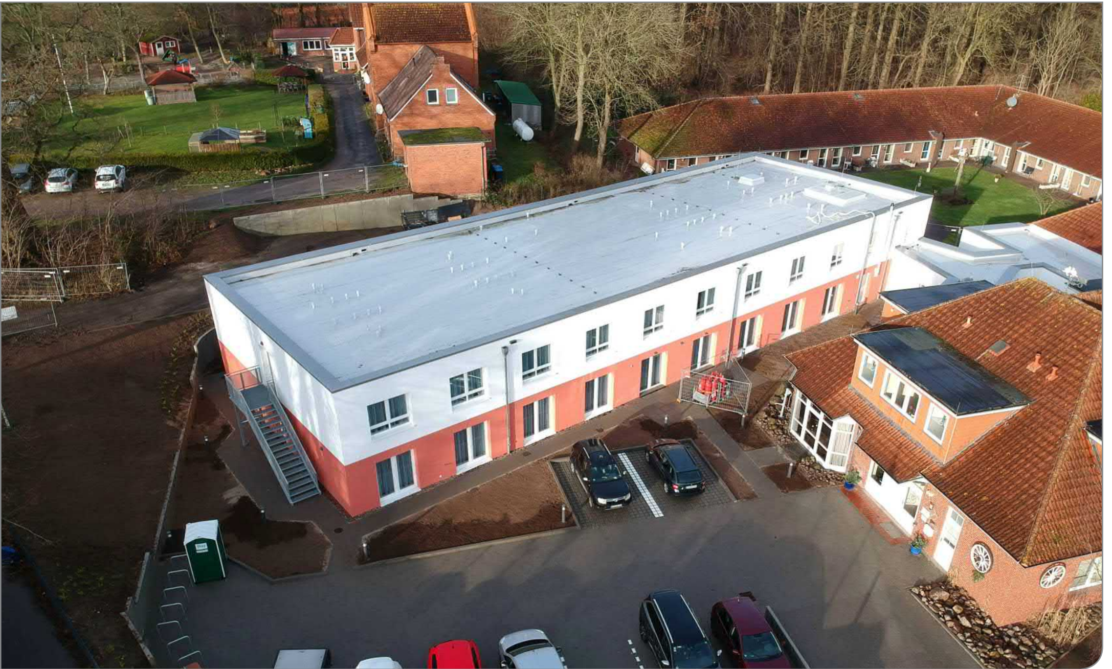
Erweiterung eines Alten- und Pflegeheimes in Dänisch-Nienhof / gebaut