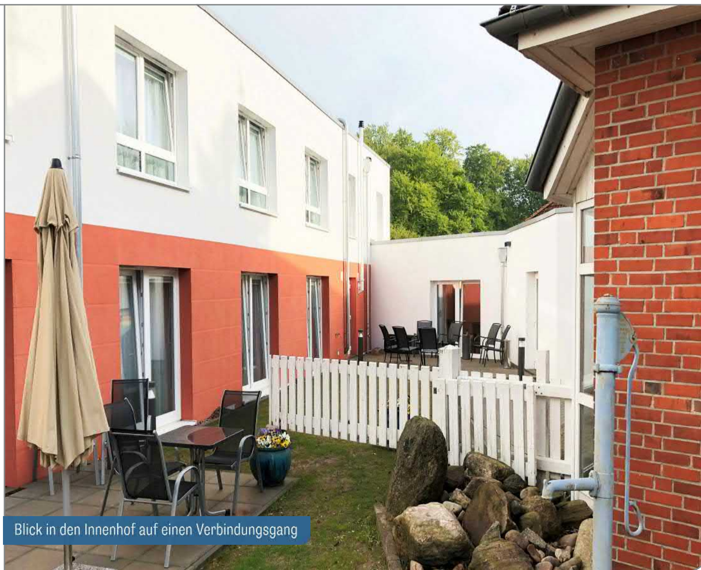
Blick in den Innenhof auf einen Verbindungsgang

Im Objekt sind pro Etage 15 Einzelzimmer vorhanden, jeweils mit einem eigenen barrierefreien Badezimmer . Die beiden Geschosse sind mittels eines Fahrstuhls verbunden. Pro Etage ist ein Gemeinschaftsraum vorhanden, in dem sich die Bewohner treffen können.