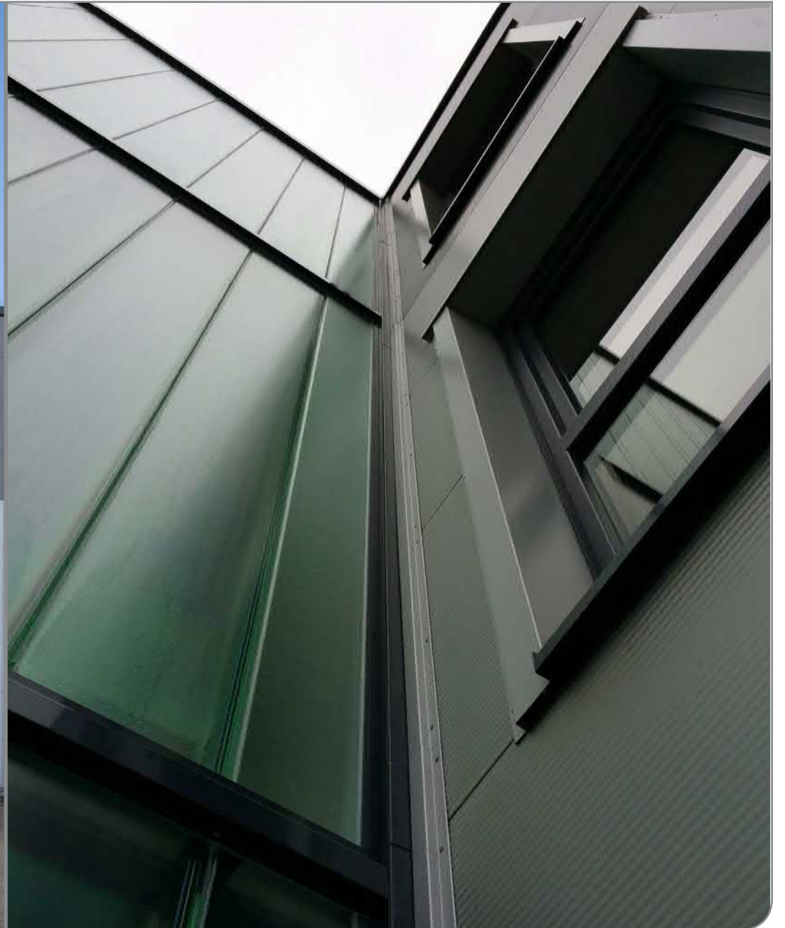
Ästhetisch und praktisch zugleich: Das außengelegene Treppenhaus.