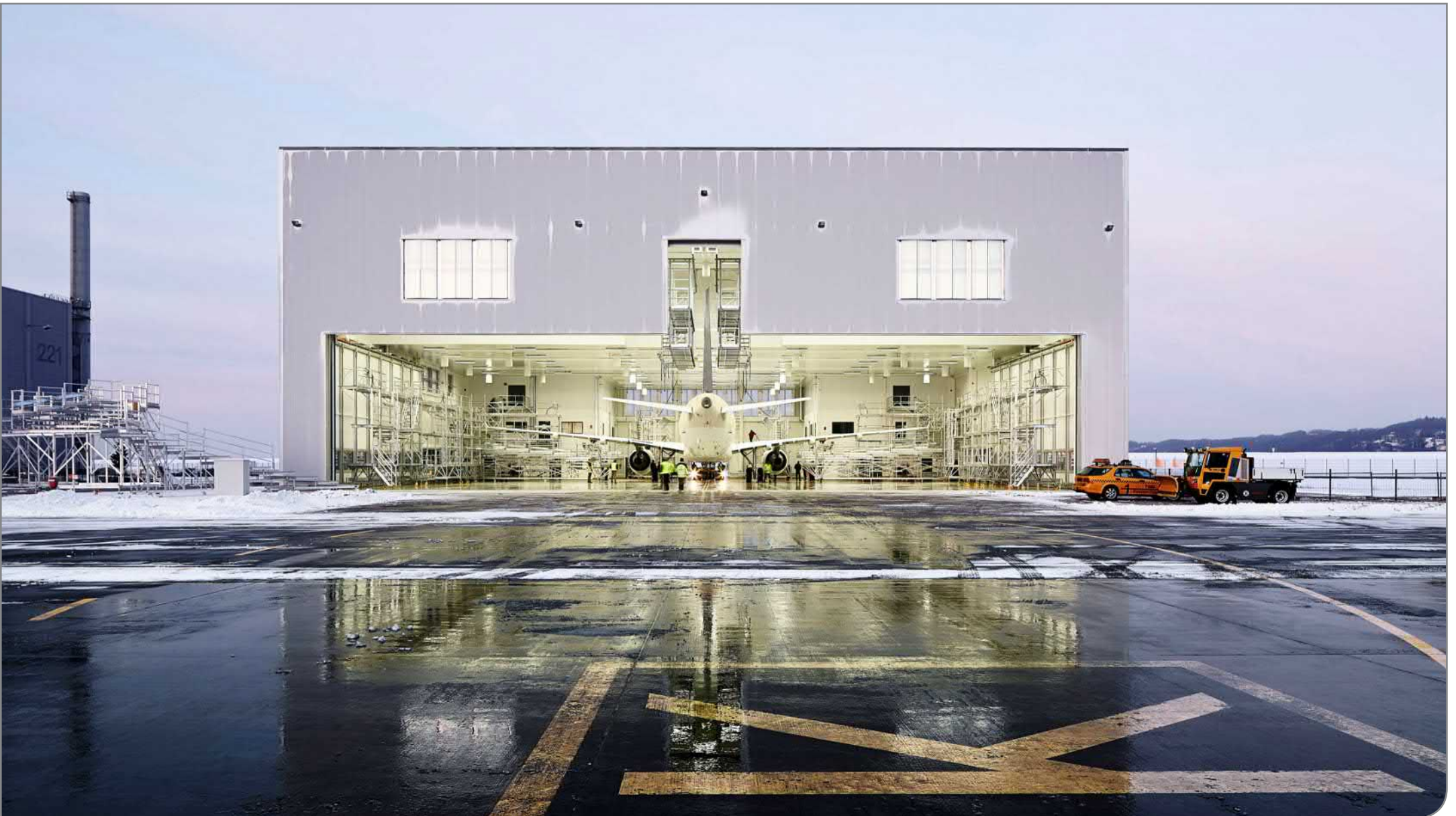
Neubau einer Flugzeuglackierhalle für MAAS Aviation auf dem Airbus-Gelände in Hamburg / gebaut