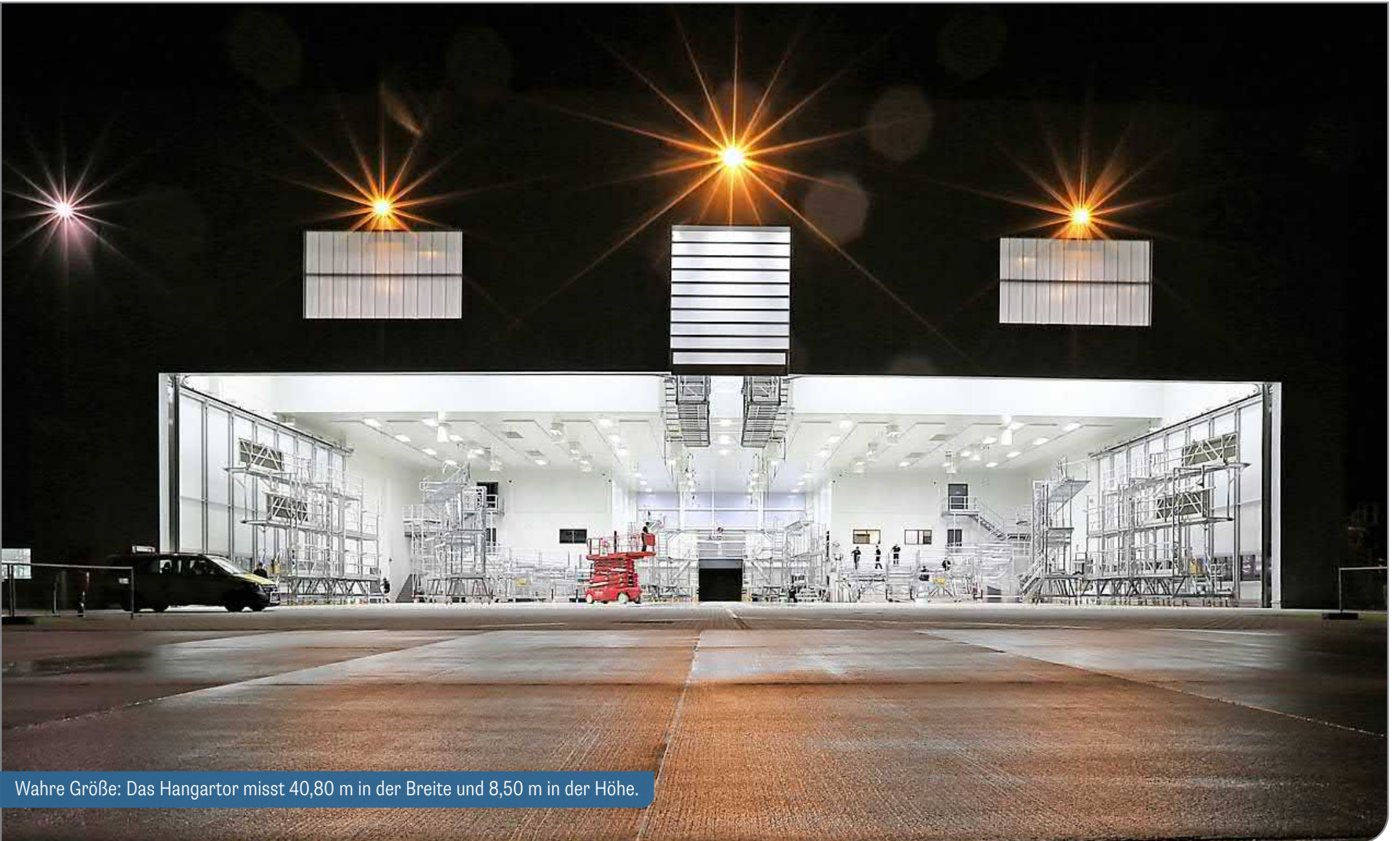
Wahre Größe: Das Hangartor misst 40,80 m in der Breite und 8,50 m in der Höhe.