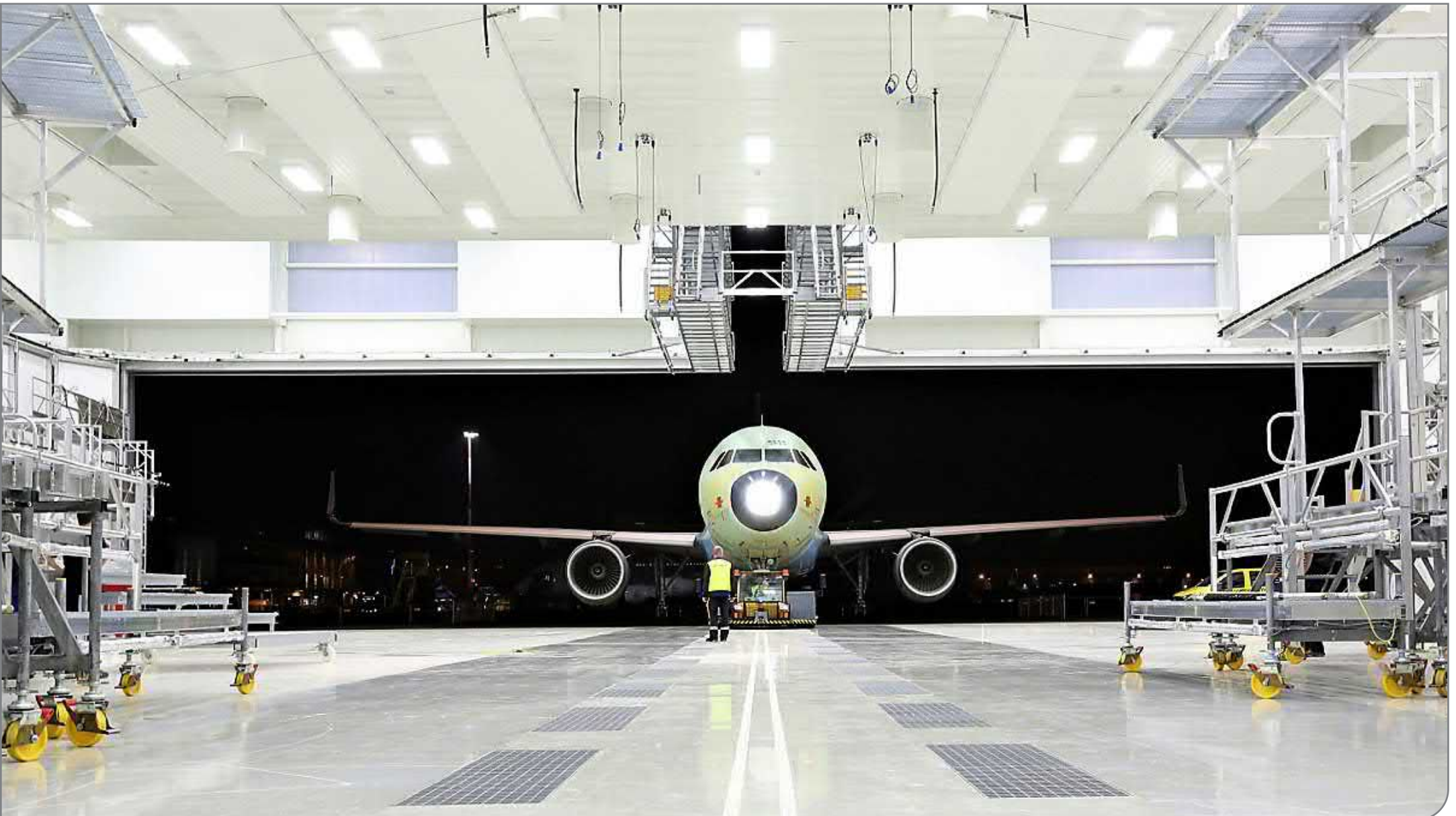
Zweite Flugzeuglackierhalle für MAAS Aviation auf dem Airbus-Gelände in Hamburg / gebaut