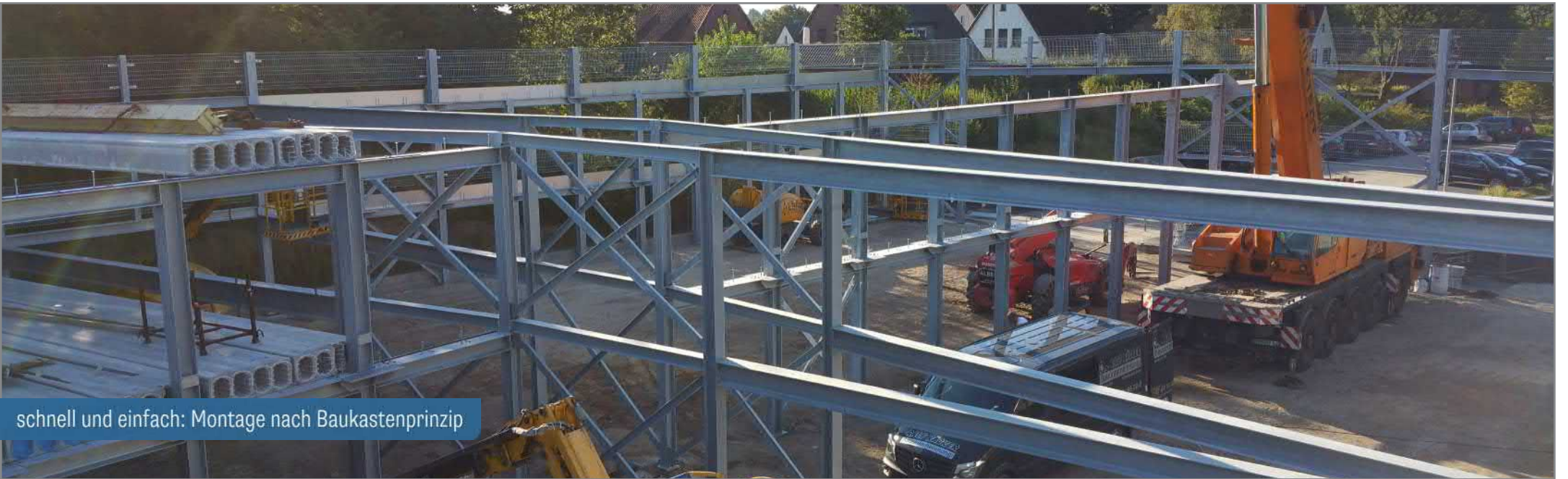
schnell und einfach: Montage nach Baukastenprinzip