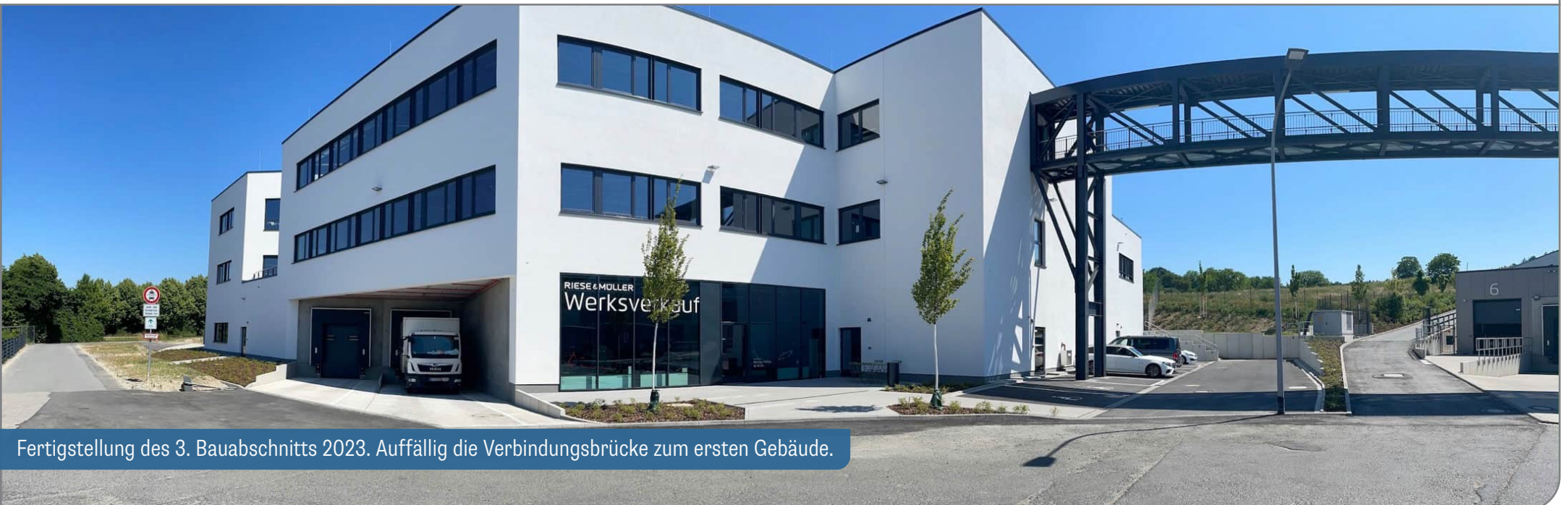
Fertigstellung des 3. Bauabschnitts 2023. Auffällig die Verbindungsbrücke zum ersten Gebäude.