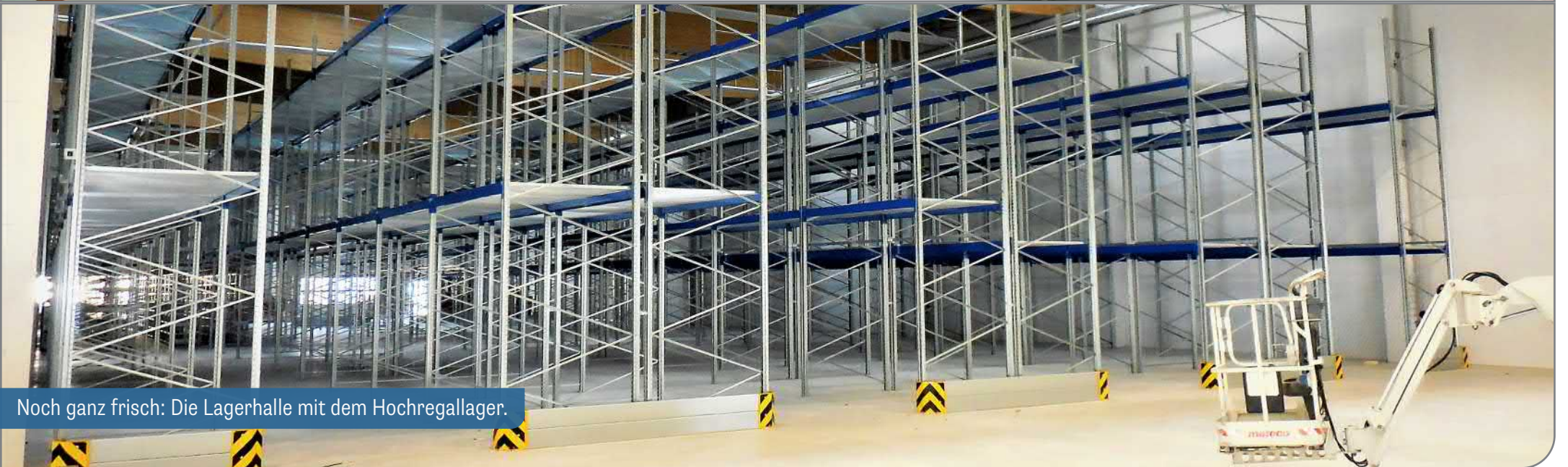
Noch ganz frisch: Die Lagerhalle mit dem Hochregallager.